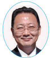
潮来市市長 潮来市社会福祉協議会会長