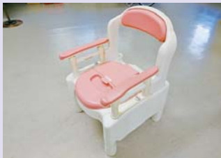
ポータブルトイレ