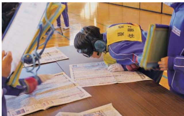
白内障用のゴーグルを付け新聞を読んでいます

2月6日（火）には牛堀小学校、2月20日（火）には津知小学校において「高齢者福祉疑似体験」が小学5年生を対象に行われました。高齢者の実生活での大変さを知ることで、子供たちは高齢者への接し方を学ぶことができました。