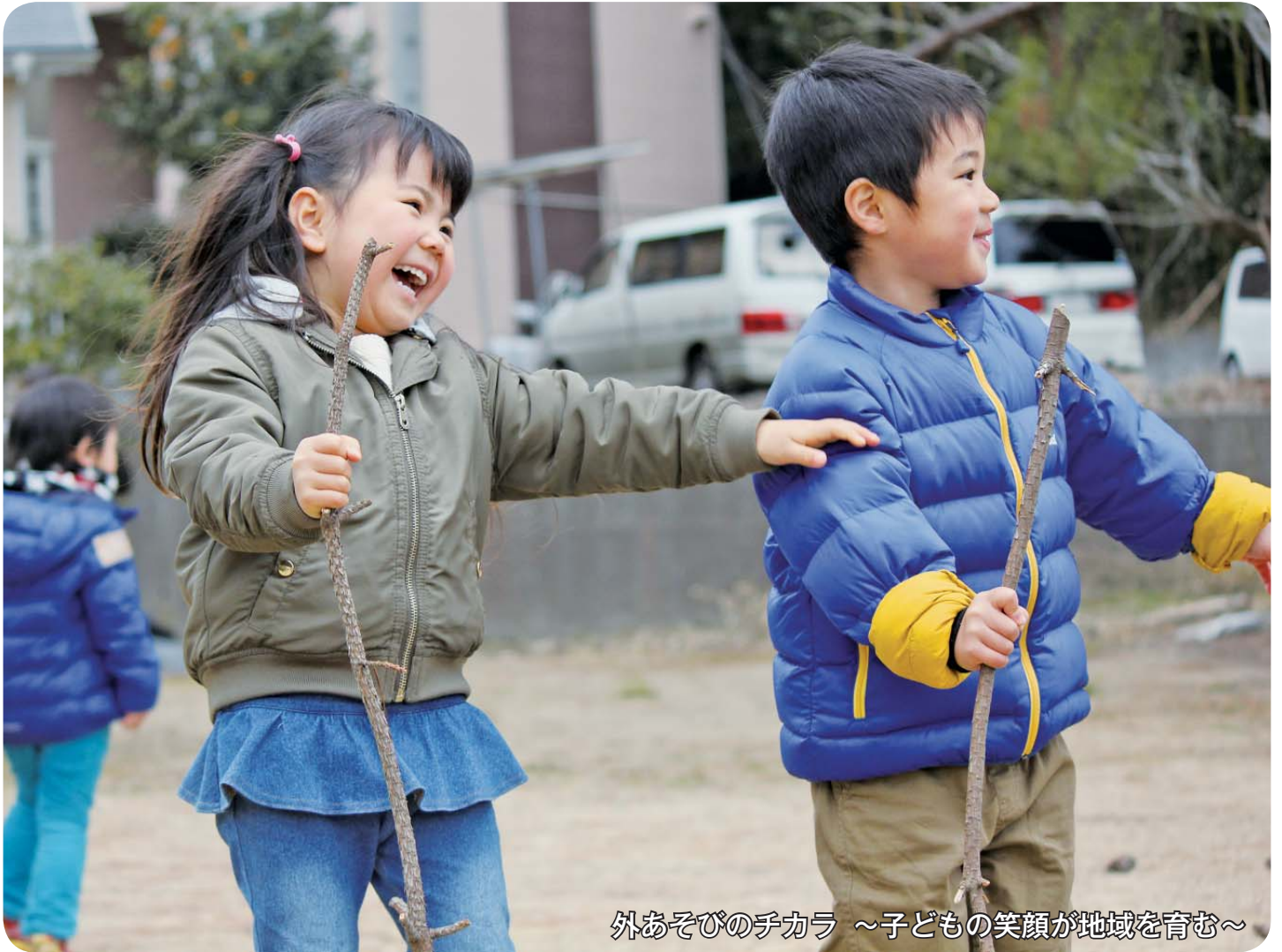
外あそびのチカラ ～子どもの笑顔が地域を育む～