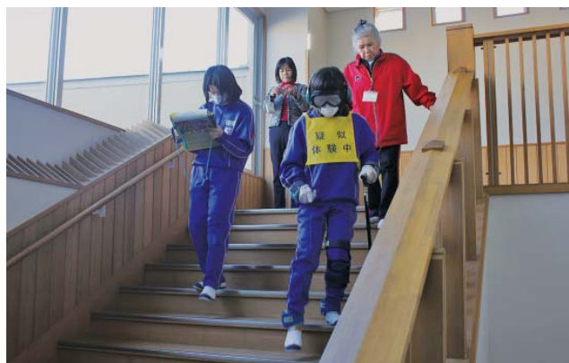
手足首に重り、肘と膝にサポーター、目と耳にゴーグルとイヤホンを付け階段を下りています