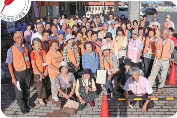
アイモアでの団結式の様子