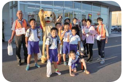
10月1日、募金活動の様子。左からホームジョイ本田、セイミヤ延方店、ウェルシア新宮南店での様子。