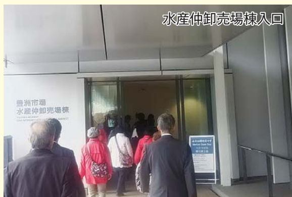
水産仲卸売場棟入口

豊洲市場は、取り扱う生鮮食料品や市場での役割に応じて3つの街区「水産仲卸売場棟」・「水産卸売場棟」・「青果棟」により構成されています。この日は主に「水産仲卸売場棟」・「水産卸売場棟」の2か所を見学しました。