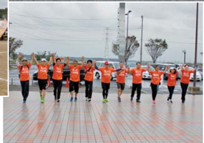
(上) スタート前に全員で記念撮影 (左上) 津知小学校でPRしながらの行進 (右) 道の駅へゴール!