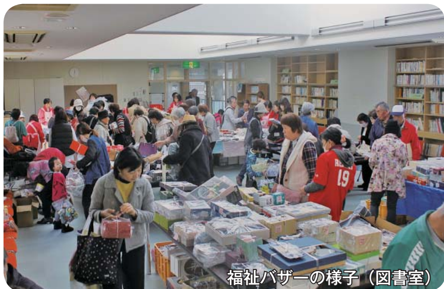
福祉バザーの様子（図書室）