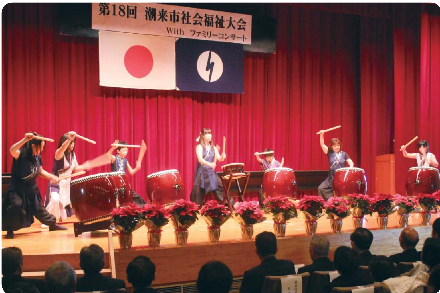
潮来 TAIKO club による力強い演奏（社会福祉大会オープニング）