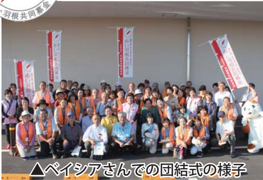
△ペイシアさんでの団結式の様子