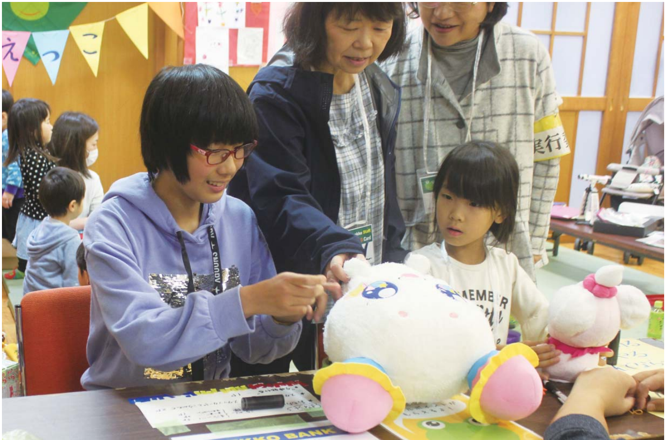
▲社会福祉大会の中で行われた「おもちゃのかえっこ」で持ち込まれたおもちゃを買い取っている様子。