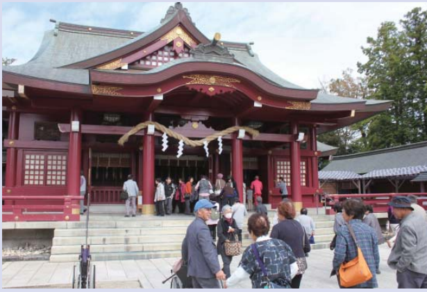
▲笠間稲荷神社での様子。足が悪い人も民生委員の補助で拝殿まで行くことができました。