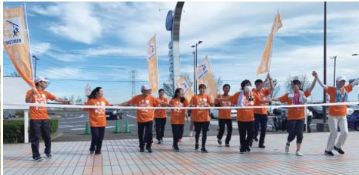
▲ゴールへ向かってラストスパート