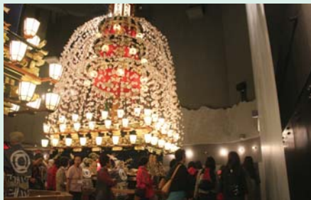
▲秩父祭り会館ではプロジェクト ションマッピングによる音と 映像の共演を楽しみました。

「有隣倶楽部」で埼玉の郷土料理をおいしくいただきました。そして宝登山神社を参拝し、親孝行の彫刻を見て、歩きながら楽しみました。今回企画を考えてくれた皆様、楽しい一日に感謝します。