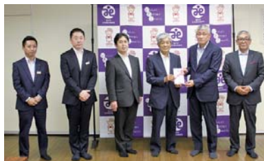
関彰商事 様 贈呈式 (5/13)

店舗改装時に発生した在庫商品を寄付いただきました。必要とする方の元へ届くよう市内関係機関と相談し、対応させていただきます。