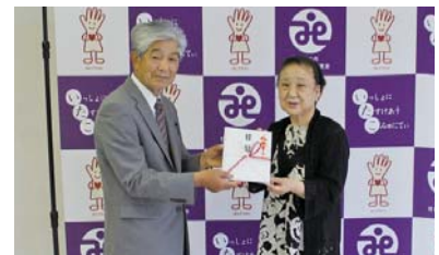
(有) 平山建材 様 (5/19)

社協事業に対して50万円の寄付をいただきました。コロナ禍に対応した事業運営に有効活用させていただきます。