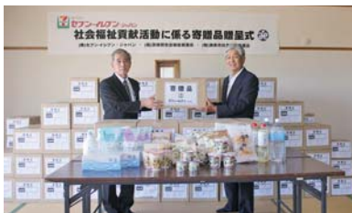
㈱セブン-イレブン・ジャパン 様 贈呈式 (5/10)

店舗改装時に発生した在庫商品を寄付いただきました。必要とする方の元へ届くよう市内関係機関と相談し、対応させていただきます。