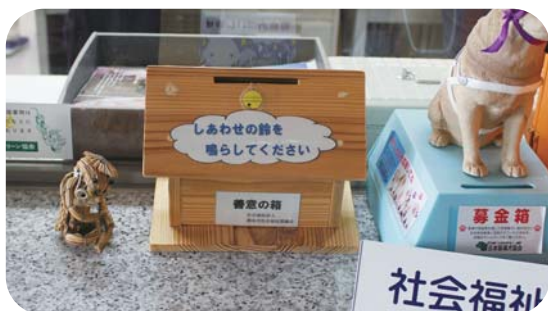
▲社協窓口に置かれた「善意の箱」。この他にもアクリルの募金箱もあります。

潮来市社協では、善意の箱という募金箱を市内の施設や商店等に設置させていただき、市民の皆様からの寄付を募っています。いただいた寄付金は、社協が推進する社会福祉事業に活用させていただいております。