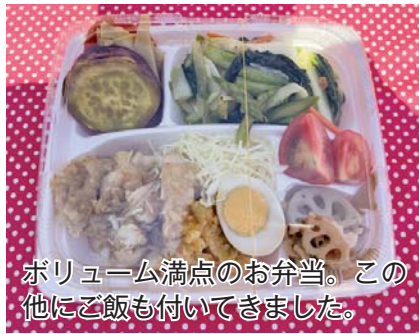
ボリューム満点のお弁当。この他にご飯も付いてきました。

者、ボランティアが集まり、食事提供のほか学習支援、レクリエーションなどを行うもの。当初はそのようなコミュニティの拠点として開始する予定でしたが、人を集めることが難しい現状で、スタッフで持ち帰り用のお弁当を作り配布することにしました。 お弁当は、地元の農家、企業の方々から協力をいただき、集まった食材を使用したスタッフが作ったもの。