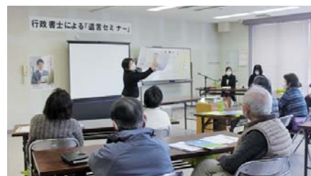
▲講義の他にも、寸劇などを交えながら、遺言の大切さを伝えてくれました。

行政書士の先生方に相続の手続きや遺言の意義、書き方などについて説明をいただきました。参加者からも、「先のことだと考えていたが夫婦でじっくりと話し合ってみようと思う。」「遺言を書いてみようと思う。」など、セミナーをきっかけに今後のことについて考える機会となったようです。