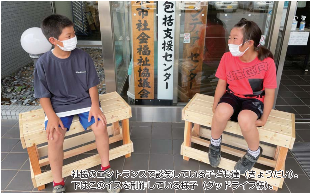
社協のエントランスで談笑している子ども達（きょうだい）。 下はこのイスを制作している様子（グッドライフ様）。