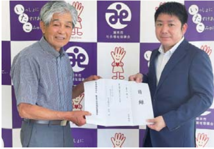
株式会社ダイナム様