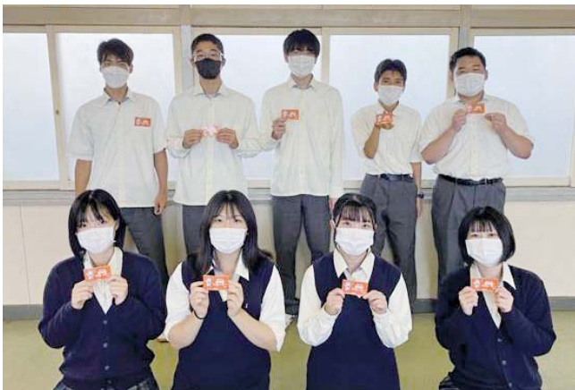
潮来高校 認知症サポーターの皆さんです！