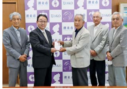
ナイルス潮寿会様