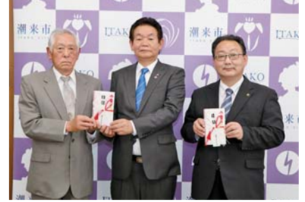
潮来ライオンズクラブ様