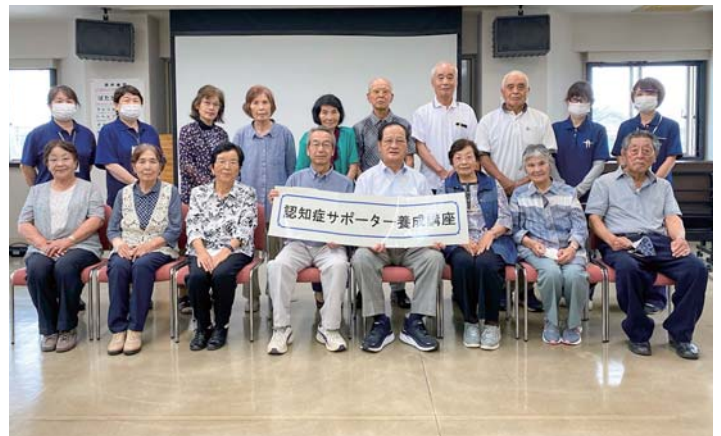
認知症サポーター養成講座を開催しています！