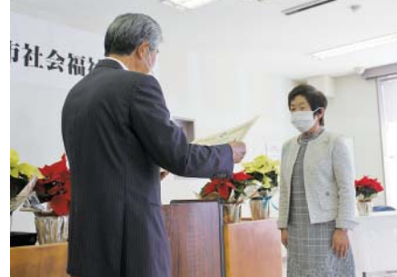
▲昨年度の表彰式の様子。