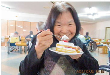
市内福祉施設5ヶ所470名にクリスマスケーキを配りました。