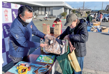
ITAKO子育て応援セットを子育て世帯にお渡ししました。