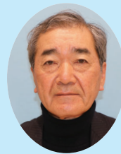
潮来市民生委員 児童委員協議会