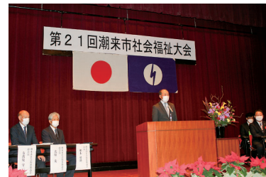
第21回社会福祉大会を開催し、地域福祉貢献活動等に携わっている皆さまを表敬しました。