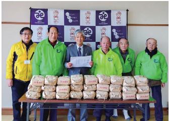
水郷潮来直販委員会様

心温まるお気持ちをお寄せくださりまして、誠にありがとうございます。お預かりした善意は社会福祉向上のために活用させていただきます。