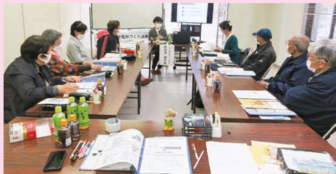
地域の居場所づくり講座を開催