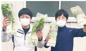
なめがたしおさい農業協同組合様