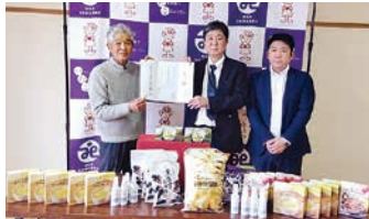
株式会社ダイナム様

心温まるお気持ちをお寄せくださりまして、誠にありがとうございます。お預かりした善意は社会福祉向上のために活用させていただきます。