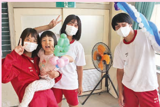
潮来高校にて福祉出前講座の協力

潮来市社会福祉協議会では、一人一人が自分らしく暮らせる地域社会づくりを進めるために、皆さまからの会費を活用させていただいております。今年度も、本会事業活動へのご理解とご協力よろしくお祈いします。