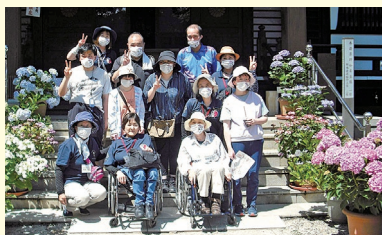
ワークス あじさいの杜見学