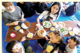
子ども食堂（にじっこカフェ）