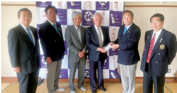
潮来ライオンズクラブ様

心温まるお気持ちをお寄せくださいまして、誠にありがとうございます。お預かりした善意は社会福祉向上のために活用させていただきます。